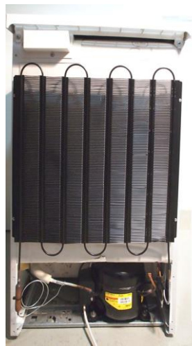
Figura 2: Al refrigerador por atrás se puede ver los tubos en espiral para el refrigerante y las "aletas refrigeradoras", así como el compresor (abajo).