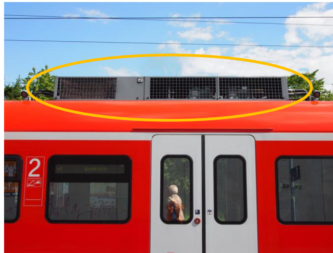
Figura 4: Aire acondicionado en el techo de un tren.

Los vagones de los trenes no están muy bien aislados, por lo que en verano el aire se calienta de manera significativa en el interior, cuando no hay aire acondicionado. Y cuando se abren las puertas, entra el aire caliente del exterior al vagón. El aire acondicionado puede mantener el tren a una temperatura constante y agradable para los pasajeros.