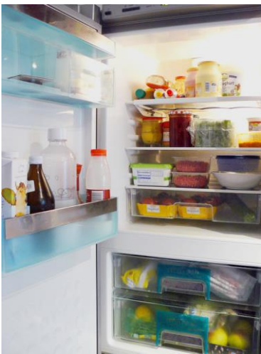
Figura 1: El interior del refrigerador

Muchos alimentos se deterioran bastante rápido a temperatura ambiente, por ejemplo, el queso o la carne. Pero a una temperatura baja y constante entre + 4 y + 8 grados centígrados, se mantienen frescos durante más tiempo y duran más. Los gérmenes que descomponen los alimentos no pueden multiplicarse tan rápidamente a estas bajas temperaturas.