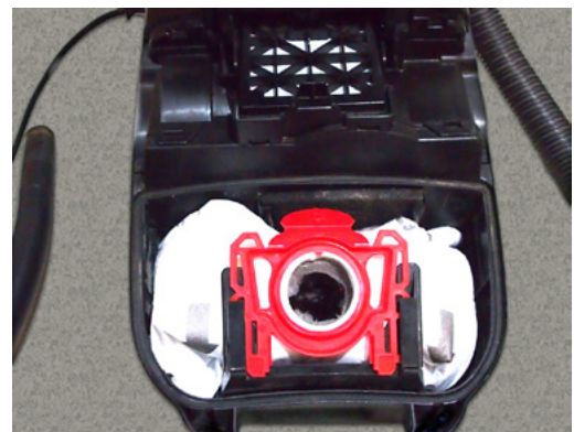
Figura 4: Aspiradora con bolsa.