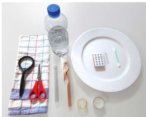
Figura 2: Materiales necesarios.