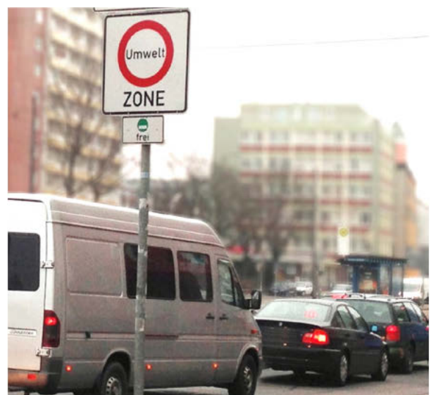
Figura 3: La señal quiere decir: Aquí se aplican las reglas para la zona ecológica.