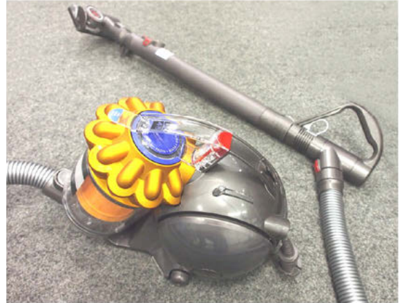
Figura 5: Aspiradora sin bolsa.

Se utilizan filtros también en los automóviles, ya que durante la combustión se generan contaminantes en el motor y estos no deben pasar a través de los gases de escape al medio ambiente.