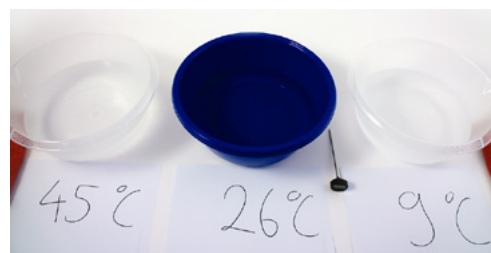
Fig. 3: La realización del experimento con tres fuentes de agua a distintas temperaturas.