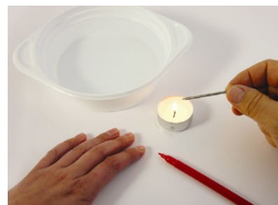
Fig. 2: La realización del experimento para determinar los puntos sensibles al calor y al frío.