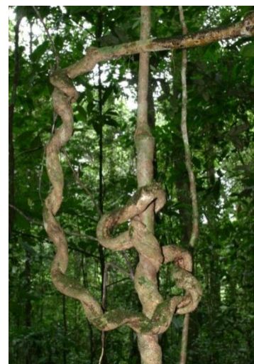
Lianas en la selva tropical.